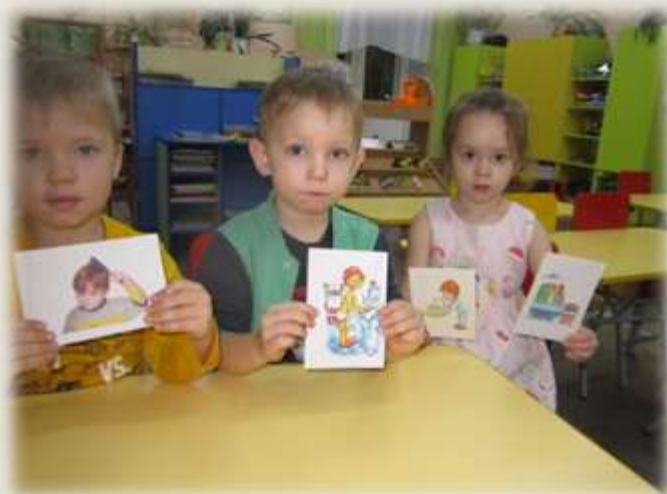
Дидактическая игра «Правила чистюли»