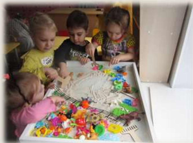
Песочная терапия «Необыкновенные следы»