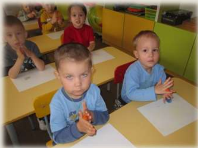
Лепка «Мой веселый, звонкий мяч»