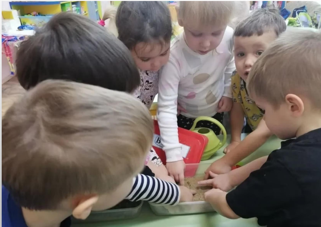
Сравниваем сухой и сырой песок