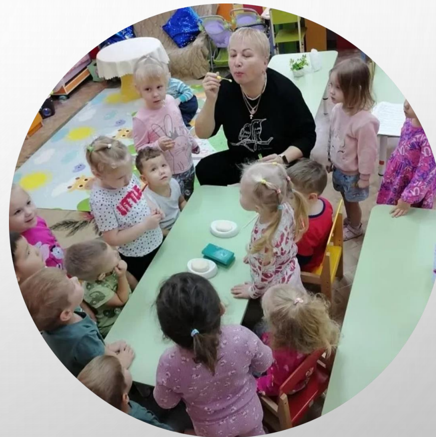
Пускание мыльных пузырей