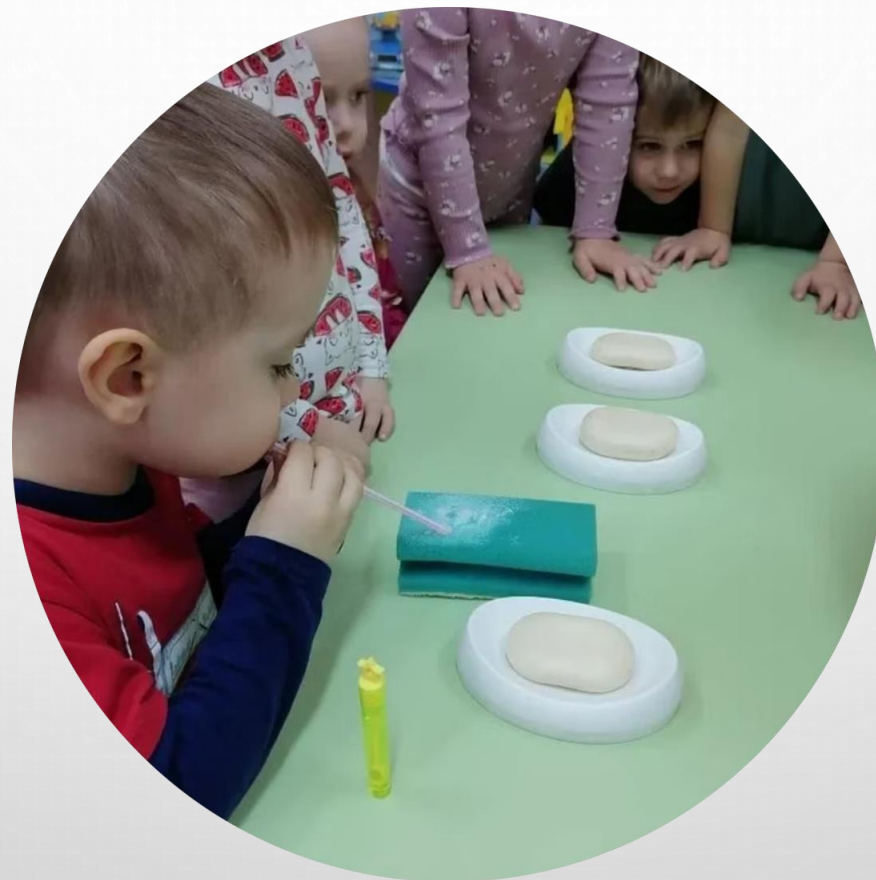
Делаем мыльные пузыри