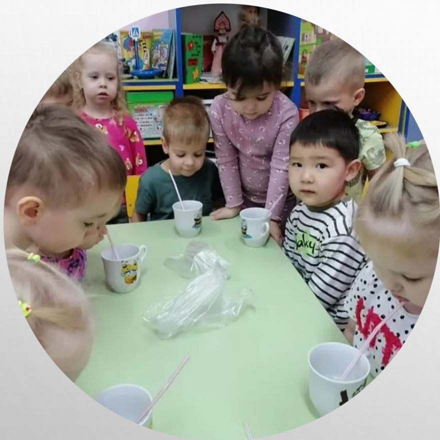
Как увидеть воздух