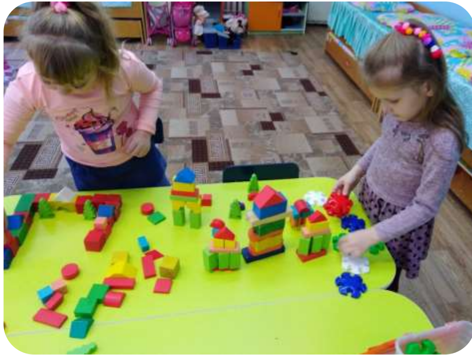
ВЫБОР КОНСТРУКТОРА ДЛЯ ПОСТРОЙКИ